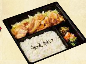
麓山高原豚 生姜焼き弁当