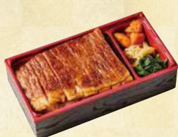
福島牛 ステーキ弁当

福島県のブランド和牛『福島牛』とブランド豚『麓山高原豚』を使用 福島県産米「こしひかり」と合わせたお弁当です