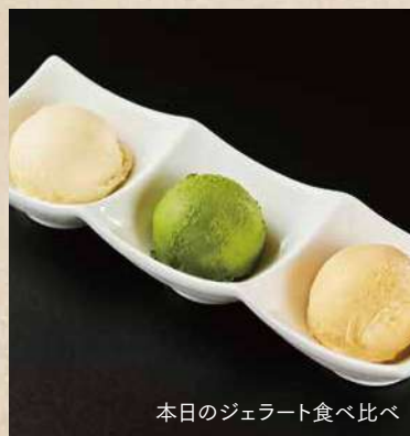
本日のジェラート食べ比べ