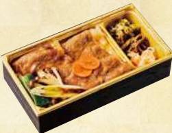
福島牛 すき焼き弁当