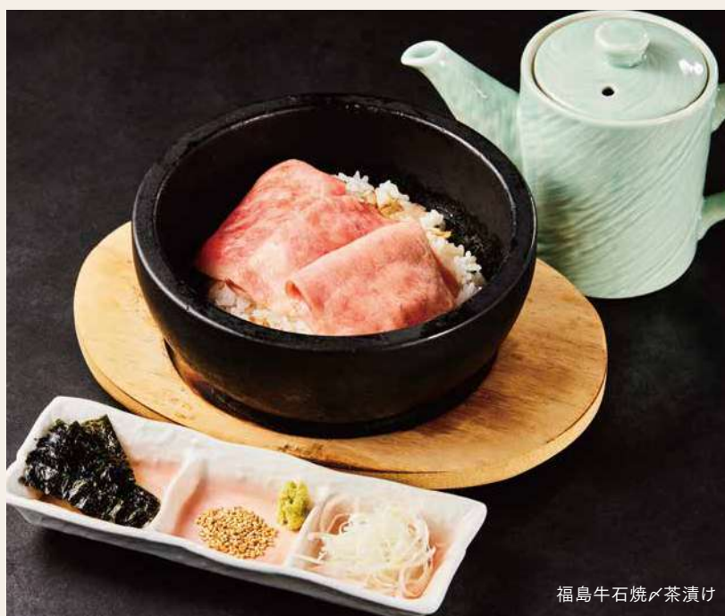
福島牛石焼茶漬け