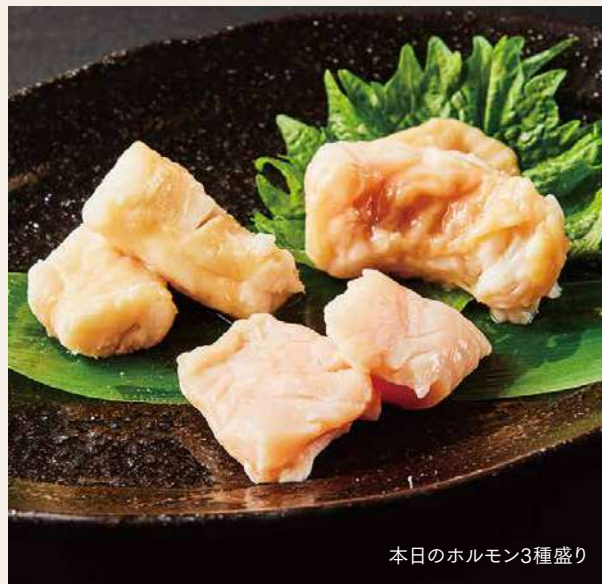
本日のホルモン3種盛り