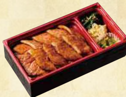
福島牛 上カルビ弁当