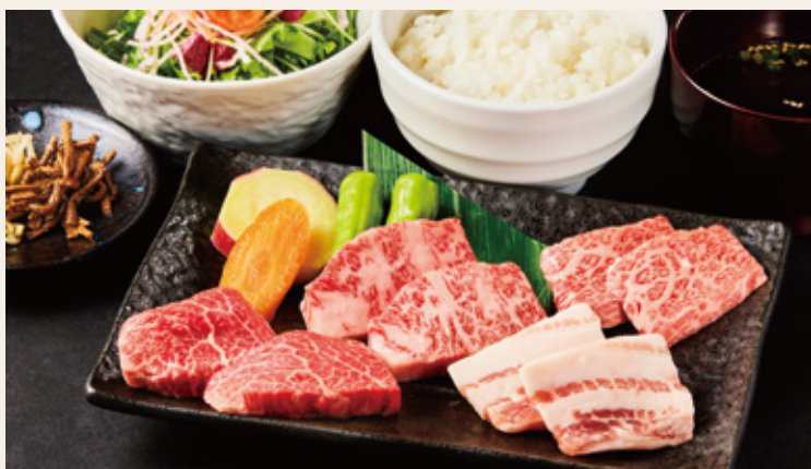
牛豊焼肉ランチ 1,590円(税込)