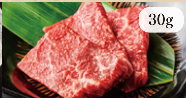
福島牛希少部位 450円(税込)