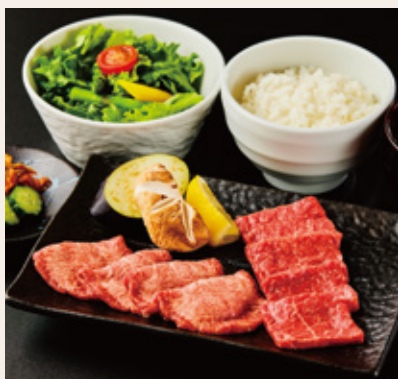
福島牛& US産牛タンランチ