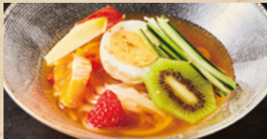
ミニ冷麺に変更 +500円(税込)