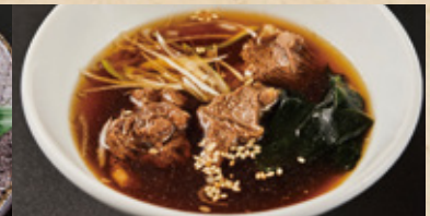
牛筋入りスープに変更 +150円(税込)