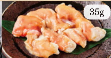
本日のおすすめホルモン 300円(税込)