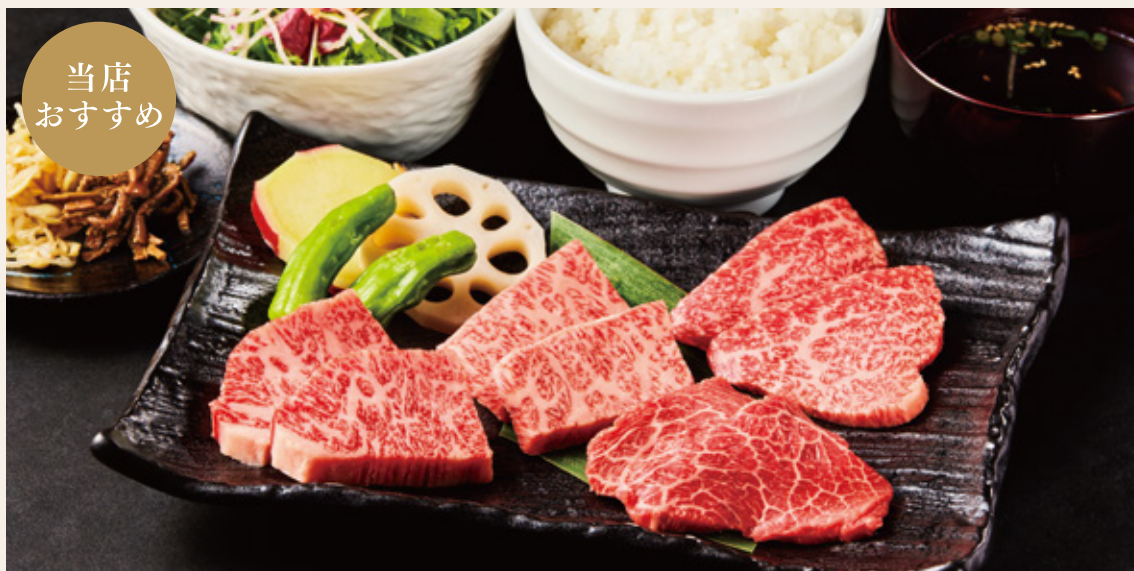
福島牛焼肉ランチ (福島牛4種)