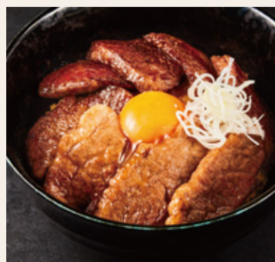
県産牛2種 食べ比べ丼 (福島牛& ふくしま煌牛(交雑牛))