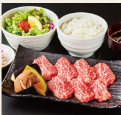
福島牛カルビ ランチ