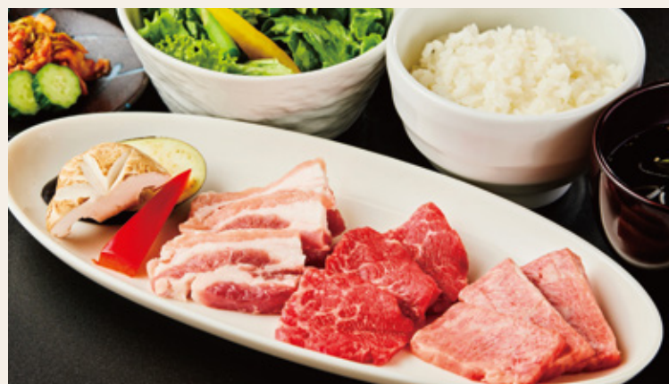
お気軽ランチ 1,390円(税込)