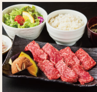
福島牛赤身 焼肉ランチ