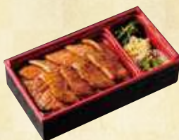
福島牛 上カルビ弁当