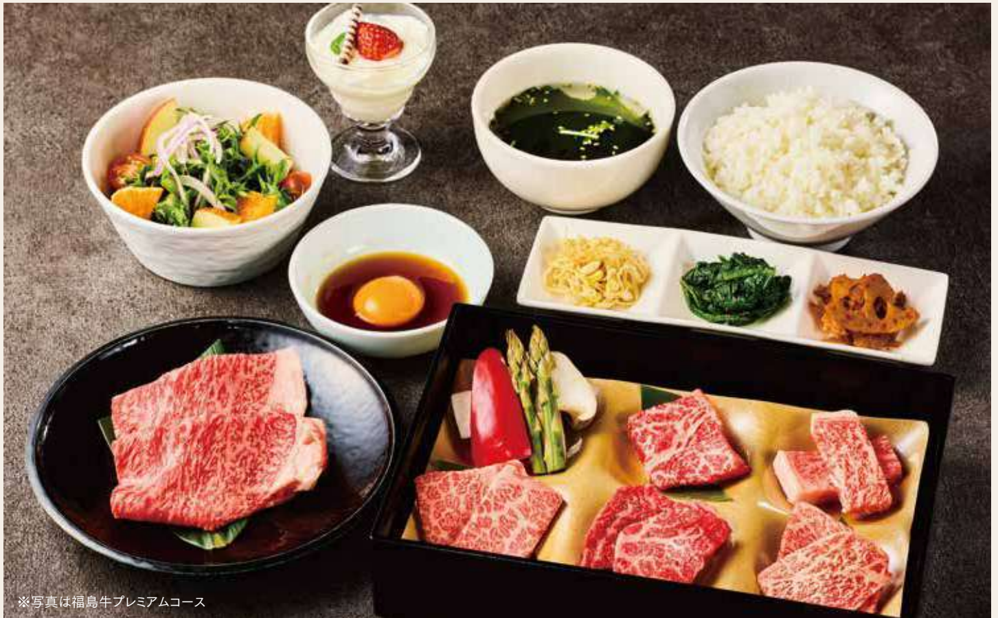
※写真は福島牛プレミアムコース