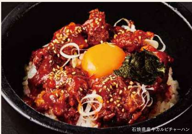
石焼県産牛カルビチャーハン