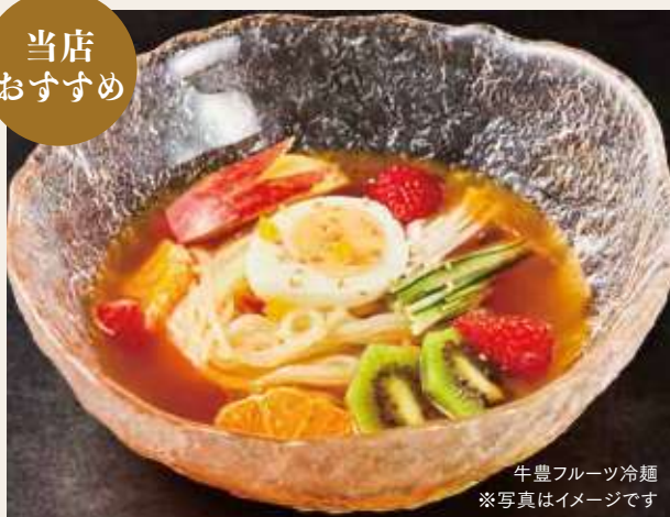
牛豊フルーツ冷麺 ※写真はイメージです