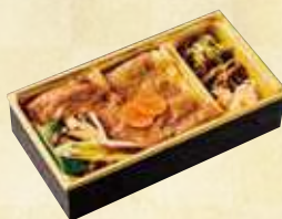
福島牛 すき焼き弁当