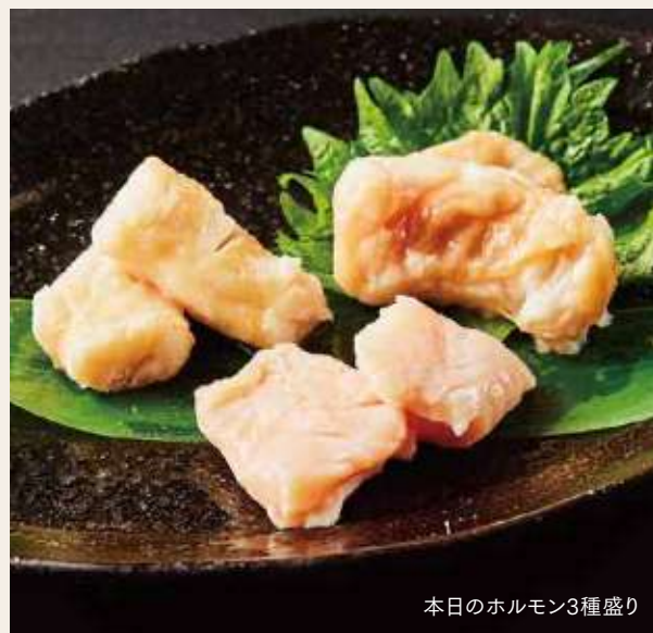
本日のホルモン3種盛り