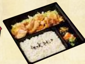
麓山高原豚 生姜焼き弁当