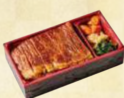
福島牛 ステーキ弁当

福島県のブランド和牛『 福島牛 』とブランド豚『 麓山高原豚 』を使用 福島県産米「こしひかり」と合わせたお弁当です