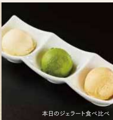
本日のジェラート食べ比べ